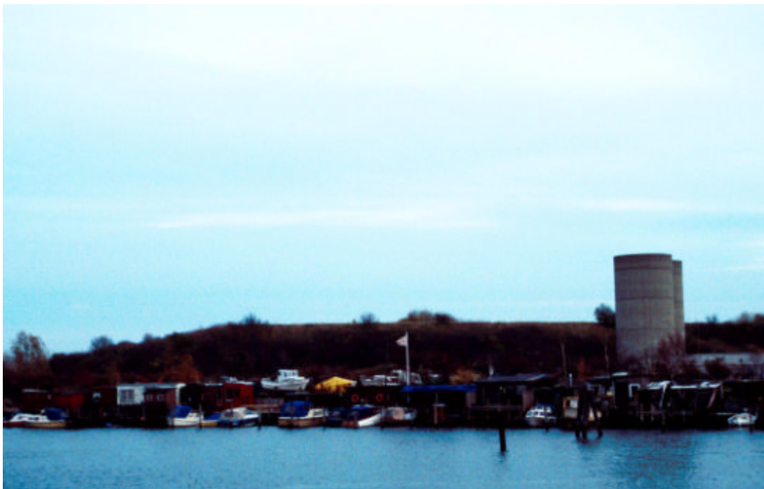
Bådeklubberne i havnen har en væsentlig eksistensbetingelse i og med deres placering på marginale jorder. Bådeklubberne i sluseområdet ligger således på en giftgrund mellem vandet, Sjællandsbroen, en pumpestation og en kommunal motocrossbane.