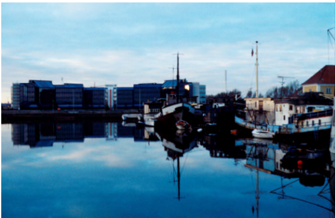
De mange forskellige aktører bruger havnen på radikalt forskellige måder - her visualiseret ved kontrasten mellem Ericssons modernistiske kontorbygning og sluseområdets klondikemiljø. Foto: Nicolai Carlberg 2000