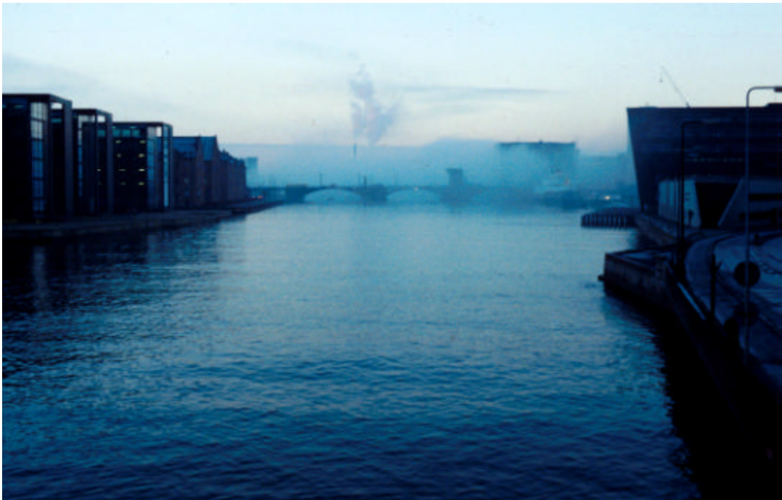
Hvad skal vandet bruges til? I modsætning til havnens/ vandets oprindelige funktion som infrastruktur, så er vandet for den havn, der vokser frem nu, primært en spejldam for moderne arkitektur.