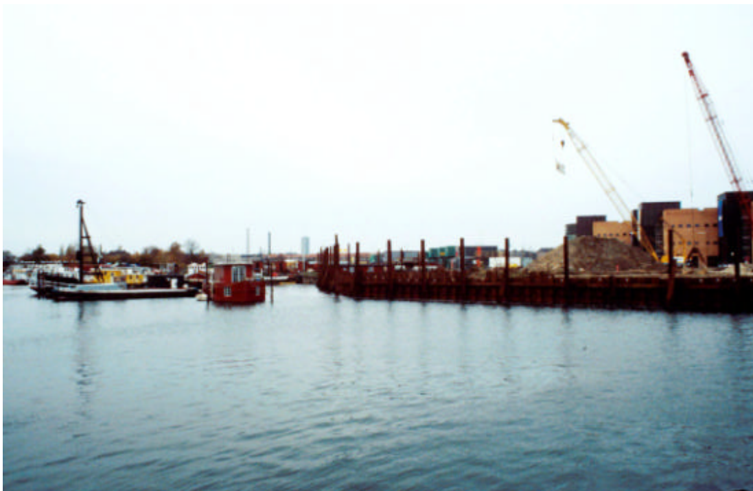
Husbådene som før lå upågtede mellem havnens industrier får nu naboer i form af boliger og serviceerhverv. Det nye naboskab vil efter al sandsynlighed føre til konflikter omkring emner som støj og æstetik. Foto: Nicolai Carlberg 2000